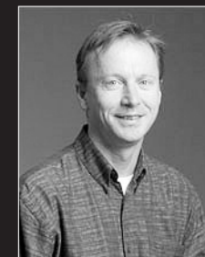
Prof. James Lock Univ. di Stanford (USA)

James Lock è professore di psichiatria infantile e pediatra presso l'università di Stanford (USA). Negli ultimi 15 anni ha sviluppato un programma di ricerca per il trattamento dei disturbi dell'alimentazione nei bambini e adolescenti. Ha pubblicato più di 200 lavori nelle più importanti riviste peer review internazionali, vari capitoli di libri e libri sui disturbi dell'alimentazione. Nel workshop James Lock descriverà in modo dettagliato l'applicazione clinica della family-based therapy for adolescents, unico trattamento evidence-based oggi disponibile per l'anoressia nervosa degli adolescenti. Il modello di cura, sviluppato presso il Moudsley Hospital di Londra, si svolge in tre fasi e tra le varie strategie include i pasti familiari in cui i genitori, sviluppando una forte alleanza tra loro, imparano a prendere il controllo della perdita di peso e della rialimentazione della figlia affetta da anoressia nervosa.