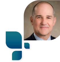
Daniel Le Grange

Daniel Le Grange è professore presso il Children's Health University of California, San Francisco (USA), ed è un esperto di fama internazionale nel trattamento degli adolescenti con disturbi dell'alimentazione. È autore di oltre 500 pubblicazioni, tra cui molti articoli e libri di ricerca e manuali per il trattamento basato sulla famiglia per l'anoressia nervosa e la bulimia nervosa negli adolescenti. È editore associato o membro del comitato editoriale delle quattro principali riviste internazionali sui disturbi dell'alimentazione. Nel 2002 è stato eletto fellow dell'Academy for Eating Disorder e ha ricevuto dall'associazione Academy for Eating Disorders Leadership in Research Award. È membro dell'Eating Disorders Research Society, dell'advisory council del National Eating Disorders Association e del Professional Advisory Panel Families Empowered and Supporting Treatment of Eating Disorders.